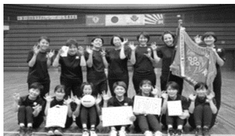
第12回全国ママさんバレーボール 冬季大会 大阪府予選会 1位 虎手爪