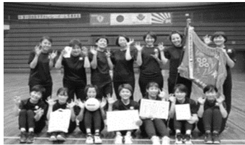
第12回全国ママさんバレーボール 冬季大会 大阪府予選会 1位 虎手爪